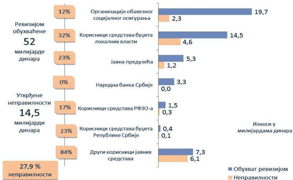
Слика број 3: Приказ неправилности у јавним набавкама по корисницима средстава

Највећи износ неправилности односи се на: