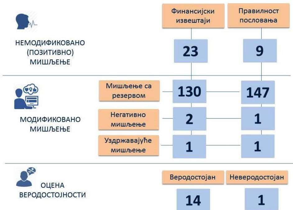
Слика број 1: Приказ изражених мишљења и оцена веродостојности

Током провере веродостојности одазивних извештаја утврдили смо да је 14 одазивних извештаја веродостојно, а један одазивни извештај је оцењен као неверодостојан.